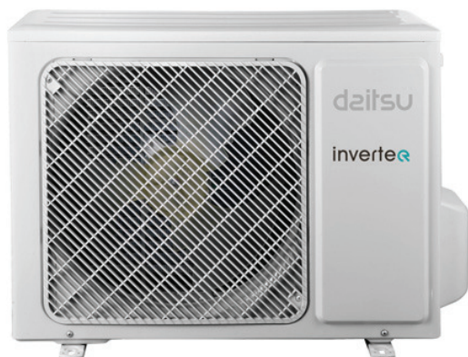
AODM 18 Ui-DN