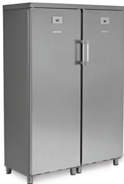
KITCF 350 PROSS INOX