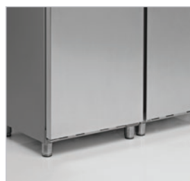
Puerta en inox.