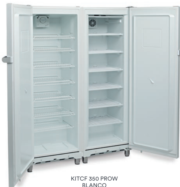
KITCF 350 PROW BLANCO