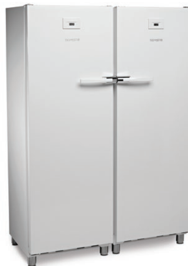
KITCF 350 PROW BLANCO