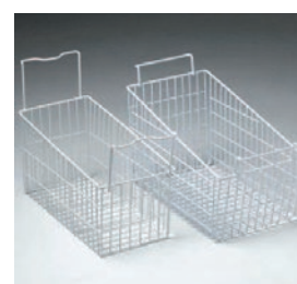
Cestas para una mejor exposición del producto (dotación).