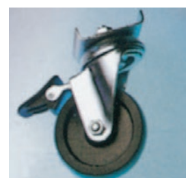
Ruedas para facilitar movilidad.