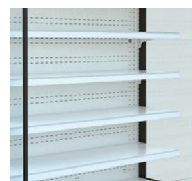
Cuatro estantes de 36 cm de fondo.