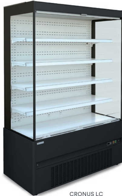
CRONUS LC (lacado)