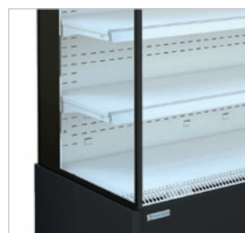
Lateral panorámico con cristal doble para una visión panorámica de los productos expuestos.