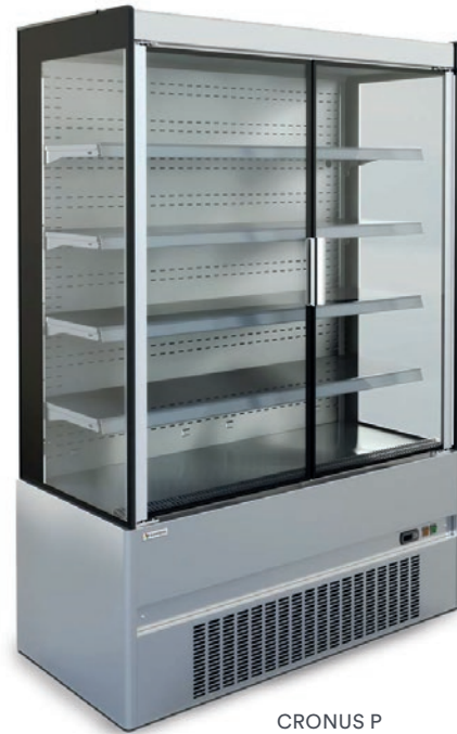
CRONUS P (inox)