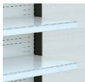
Perfiles portaprecios transparente en PVC.