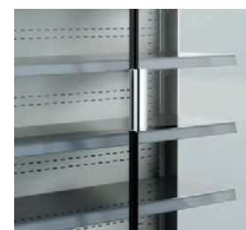
Puertas de cristal doble.