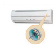
Motor High Power DC.