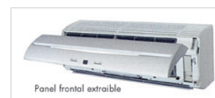
Panel frontal extraíble

Los filtros absorben todo el polvo fino, las esporas de moho invisibles y microorganismos dañinos, y realizan la desodorización descomponiendo los olores absorbidos mediante oxidación y reduciendo los efectos de los iones generados por la cerámica de partículas ultrafinas.