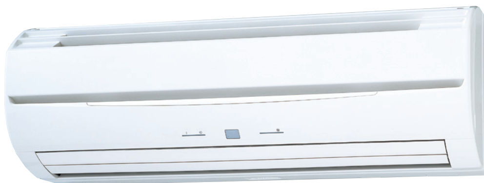
ASYE 4-14 G / ASYA 4-14G