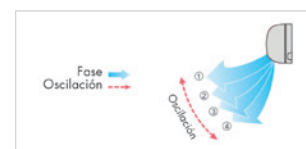
Rejilla de ventilación de oscilación automática.