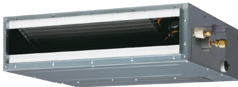
ARYD 4-14 G