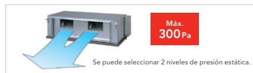
Alta presión estática (ARYC 72-90).

Peso ligero: se ha desarrollado una unidad interior compacta y ligera reduciendo el chasis básico y el peso total del material.