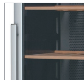
Puerta reversible e iluminación interna.