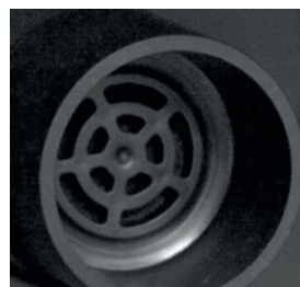
Filtro de carbón que limpia el aire y evita que entren impurezas que afecten al vino.