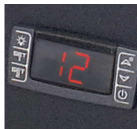
Termostato para regular la temperatura con display digital. Tras fijar la temperatura, la regulación se hace electrónicamente.