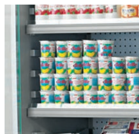
Estantes: - regulables e inclinables. - fondo 35 cm. - incluyen portaprecio de plástico.