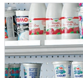
Rejilla frontal blanca opcional (ver accesorios).