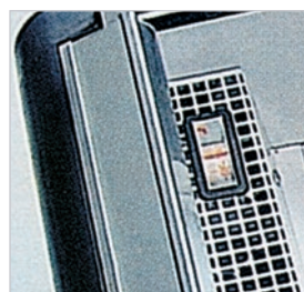
Parte anterior: - perfil portaprecios. - termómetro.