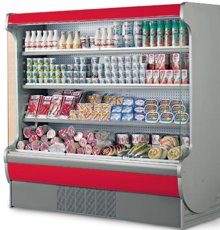
VENERE PANORÁMICA (rojo estándar)