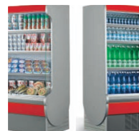
Laterales: - panorámicos con una superficie en cristal. - totalmente ciegos.