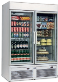
TORNADO V 100 TN-BT