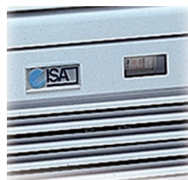
Termómetro indicador de la temperatura interior.