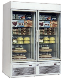
TORNADO V 100 BT-BT