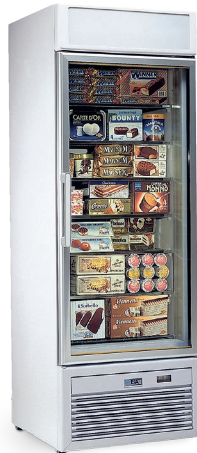
TORNADO S40 BT