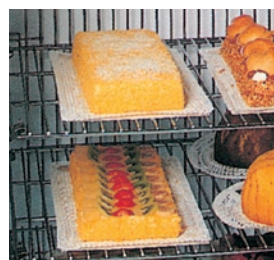
Modelos TN : Estantes de rejilla metálica regulables en altura. Modelos BT: Estantes de rejilla metálica fijos.