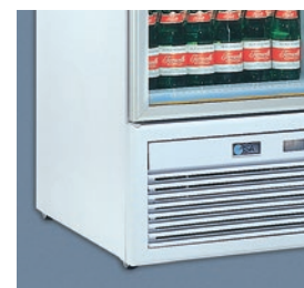
4 ruedas y 2 pies estabilizadores.