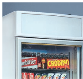
Display luminoso personalizable.