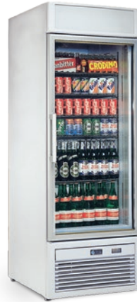
TORNADO V 50 TN