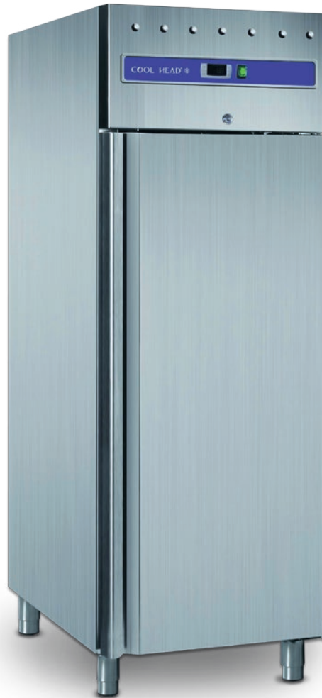
SNACK 400 TN