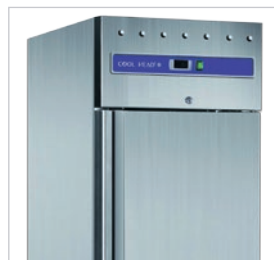
Estructura interna y externa en acero inoxidable.