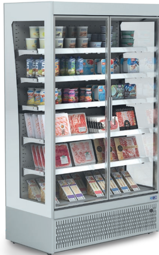
SLIM GD (con puertas)