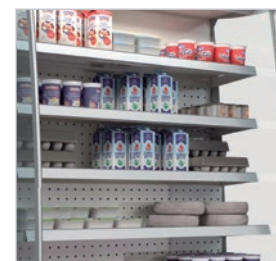
Laterales panorámicos para una mejor exposición del producto.