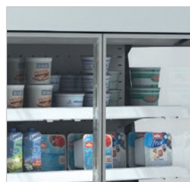
Modelos GD con puerta de doble cristal.