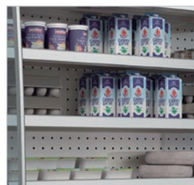
5 estantes de serie de 30 cm de profundidad.