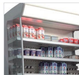
Iluminación superior en todos los modelos sin puertas.