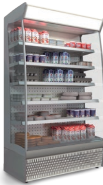
SLIM (sin puertas)