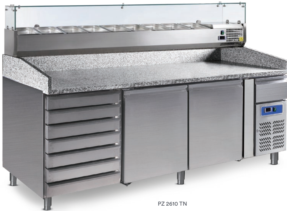
PZ 2610 TN