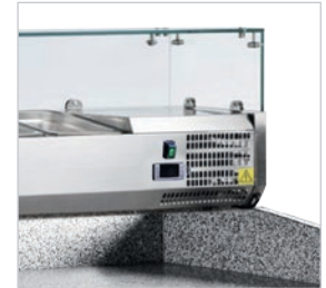
Desescarche automático para todos los modelos.