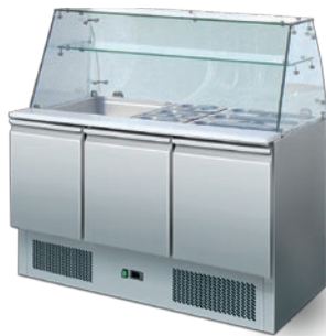
S 903 SQ