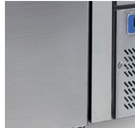
Cerradura de serie.