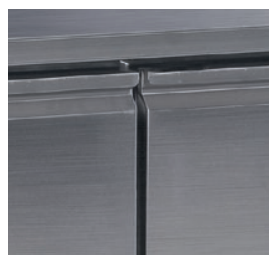
Acabados interiores redondeados para una limpieza fácil.