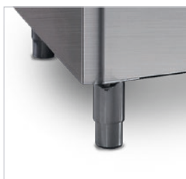
Pies regulables en altura.