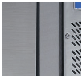
Cerradura de serie.