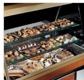
2 filas de estantes en dotación en cada vitrina.