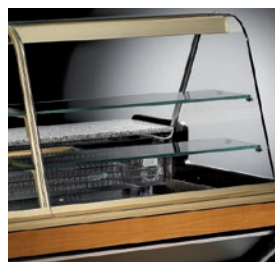
3 niveles de exposición de los cuales el inferior es refrigerado y los dos superiores sin frío.