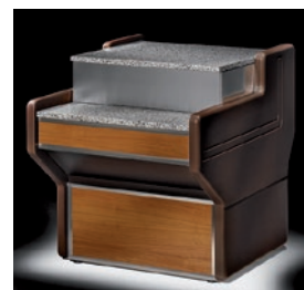
Mueble caja con laterales (opcional).