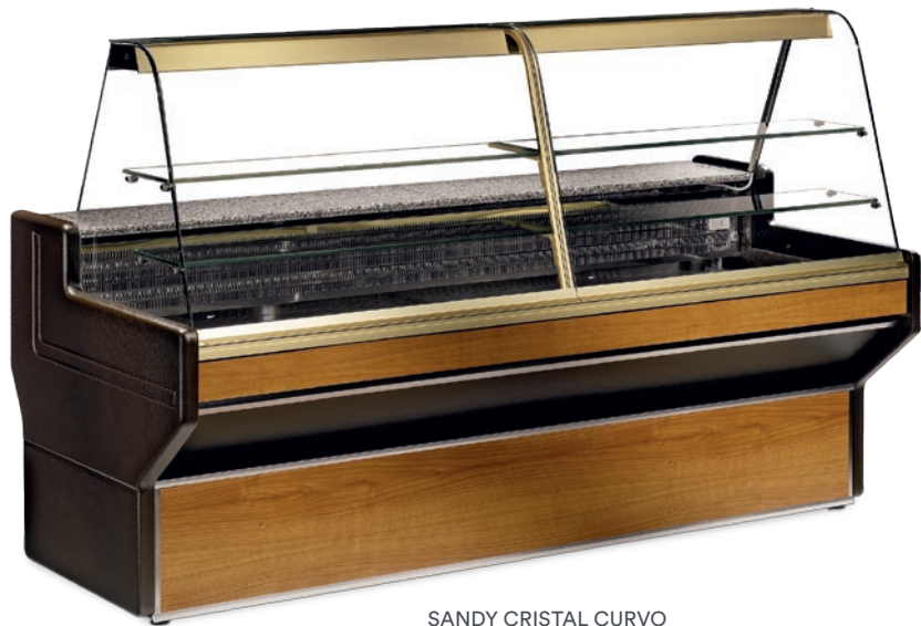
SANDY CRISTAL CURVO