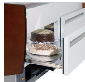
Cajones deslizantes para facilitar la reposición del producto.