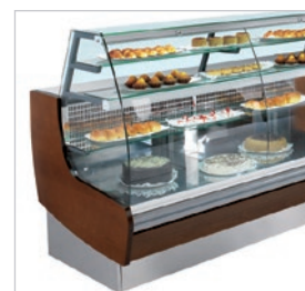
Acabados en madera wengé (tanto el perfil frontal como los laterales).