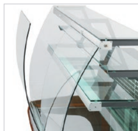
Detalle de los 3 niveles de estantes (1 refrigerado) y de los cristales abatibles.