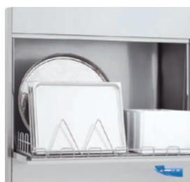
Permite el lavado de bandejas para pastelería 40x60 cm.