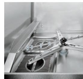
Filtro integral del depósito en acero inoxidable AISI 304 que facilita la limpieza del agua.