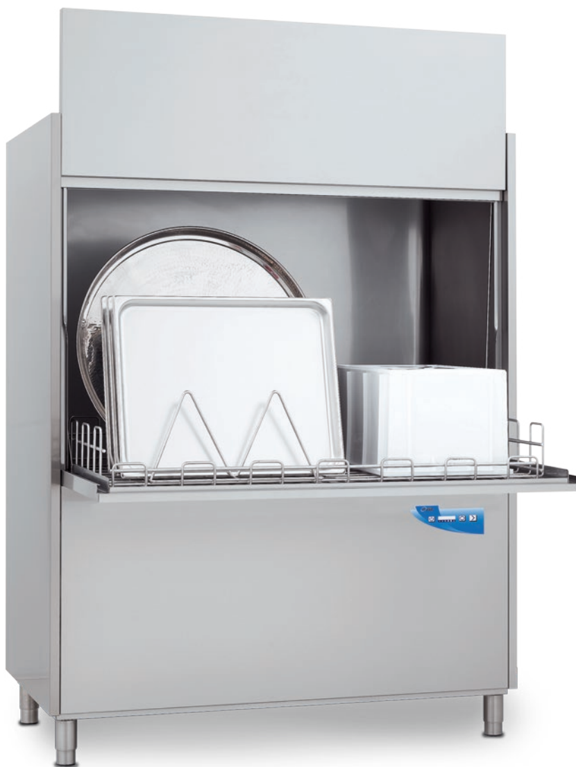
RIVER XP 298