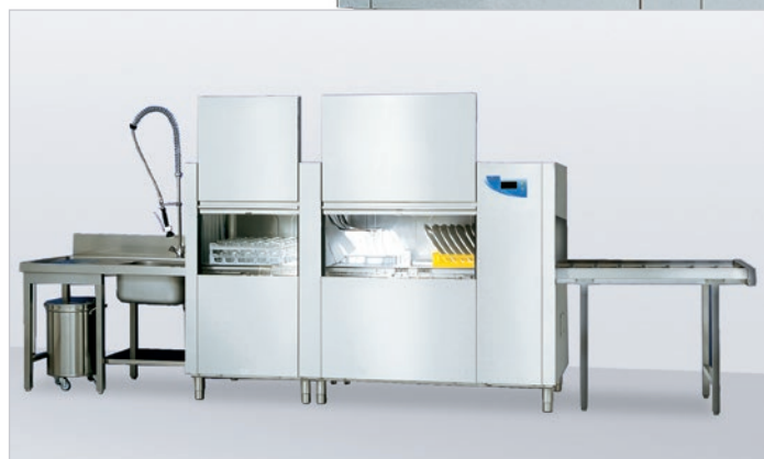
RIVERMULTI 2258 con accesorios opcionales