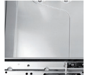
Doble pared que reduce el nivel sonoro, cuba completamente estampada, doble filtro de acero y cámara de lavado sin tubos internos para una mayor higiene de la máquina.