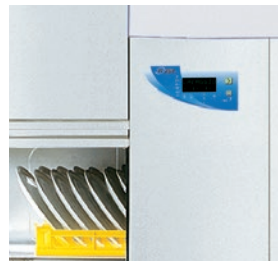
Panel de control de fácil entendimiento para garantizar la sencillez de uso.