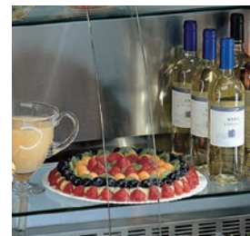
Con estantes de cristal en dotación.