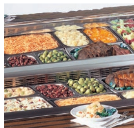
Distribución interior adaptada para colocar cubetas Gastronorm.