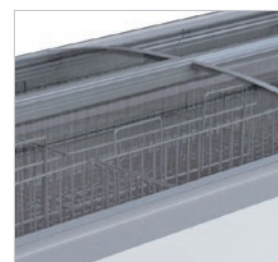
Rejillas perimetrales incluidas.