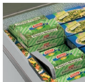
Tapas correderas de cristal con asas.