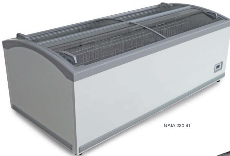
GAIA 220 BT