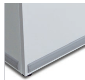
Parachoques de protección.