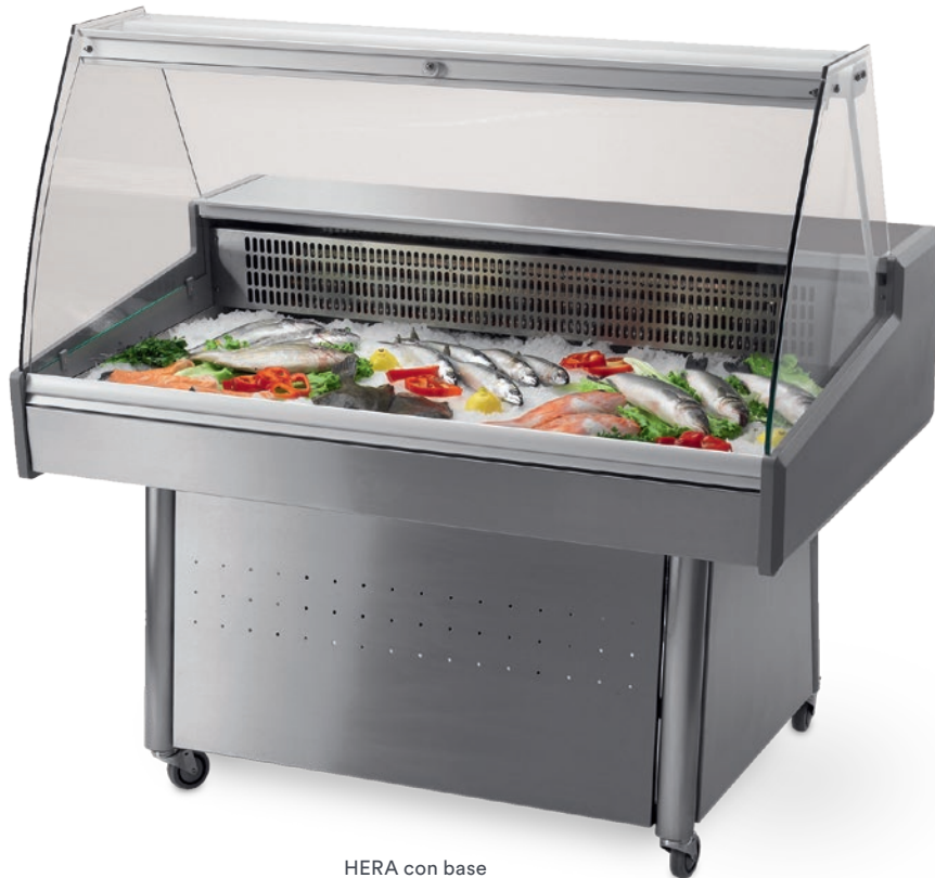
HERA con base