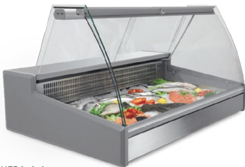
HERA sin base