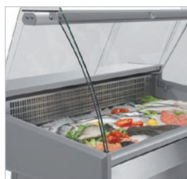
Cristales curvos abatibles.