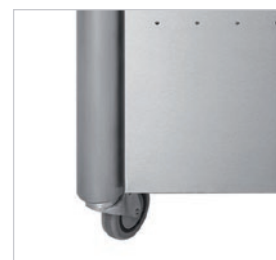
Base de acero inoxidable con ruedas.