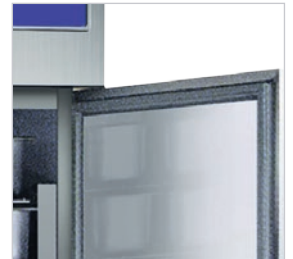
Ángulos redondeados para una limpieza más fácil.