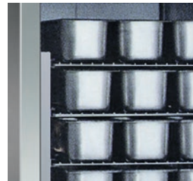
Estructura interna y externa en acero inoxidable.