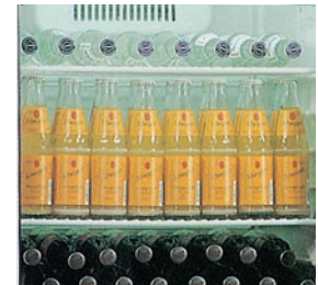
Refrigeración estática con turbina de ventilación.