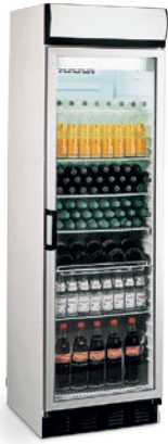
FKG 410 (DISPLAY)