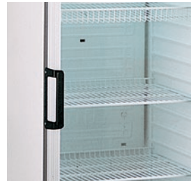
Estantes metálicos plastificados regulables en altura.