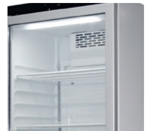
Iluminación led de serie en todos los modelos.