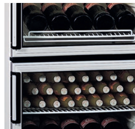
Puertas con apertura reversible.