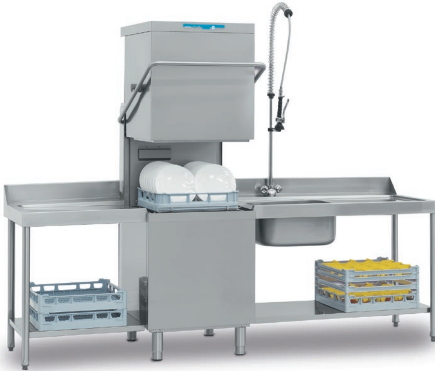
OCEAN 380 (Mesas opcionales)