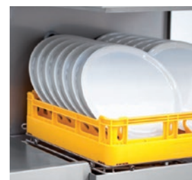
Platos 400 mm de altura.