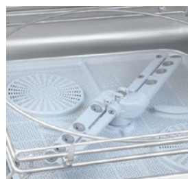
Brazos de lavado rotativos.