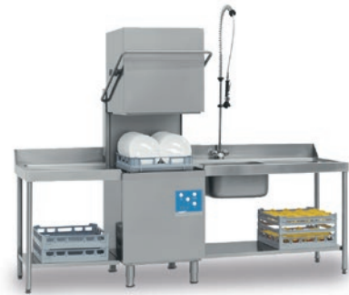
FAST 180 (Mesas opcionales)