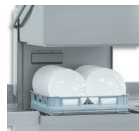
Nueva generación de lavaplatos de campana con cesta de 50x50, construida con pared simple.