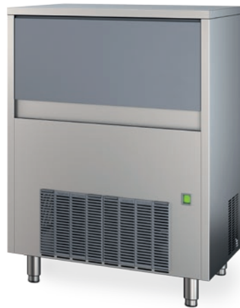
CP / CG 68