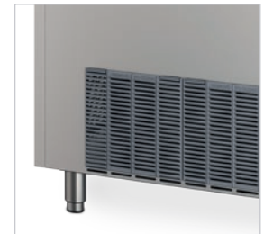
Pies regulables en altura a partir del modelo CP-CG 37.