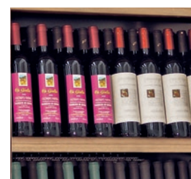
GROTTA 600 5 TV: La distribución interior con estantes en escalera permiten una gran capacidad de botellas.