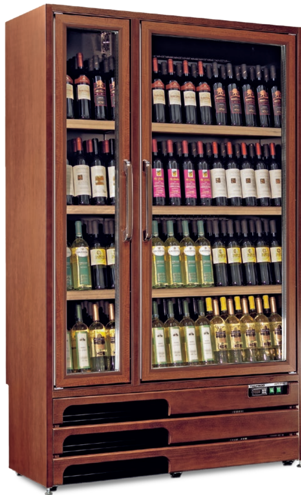
GROTTA 600 5 TV