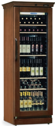
CANTINETTA GLASS LUX