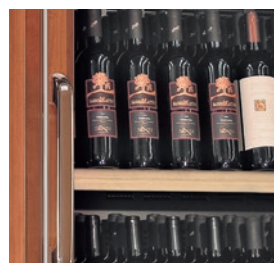
Nogal barnizado oscuro.