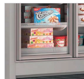
Vitrina mural ideal para la conservación en baja temperatura.