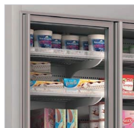
Puertas de doble cristal.