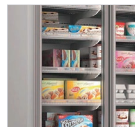
5 estantes de 48 cm de fondo.